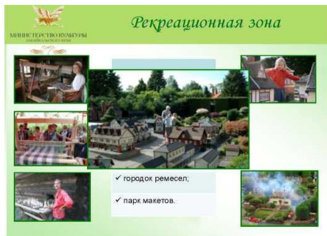
Рис. Примеры разработки концепций тематических гостинично-ресторанных комплексов